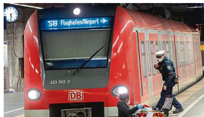
Die einfahrende S8 kam nur wenige Meter vor der Frau im Gleis zum Stehen.

Wie es vonseiten der Polizei heißt, befand sich der Mann bei der Tat in einem psychischen Ausnahmezustand. Er war den Menschen auf dem S-Bahnsteig kurz vor 21.25 Uhr bereits aufgefallen, weil er dort völlig unvermittelt einen Hund getreten hat. Kurz darauf schubste er von hinten die Angestellte, die er nicht kannte, über die Bahnsteigkante. Ausgerechnet in dem Moment, als die nächste S-Bahn in den Hauptbahnhof eingefahren ist.