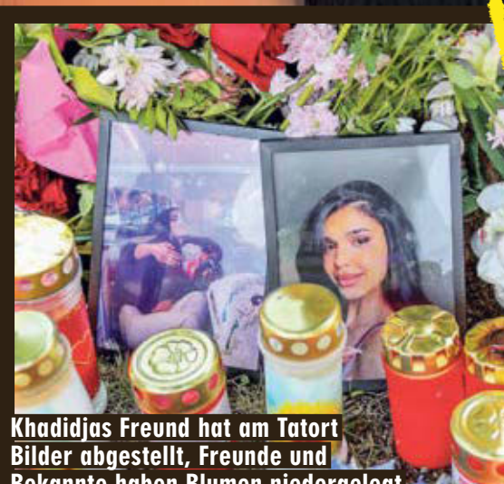
Khadijas Freund hat am Tatort Bilder abgestellt, Freunde und Bekannte haben Blumen niedergelegt