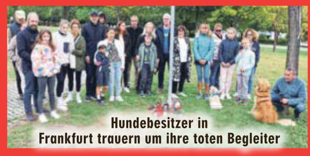
Hundebesitzer in Frankfurt trauern um ihre toten Begleiter

schwächen Herz und Atmung des Tiers. Die Motorik fällt aus, der Hund bekommt Krämpfe. Gerade bei kleineren Hunden können schon geringe Mengen (aufgenommen durch die Nase oder Zunge) schnell zu einer Überdosis und damit zum Tod führen.