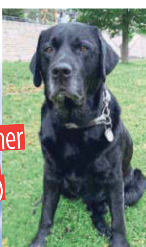
Labrador Lennox (†10)