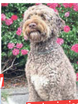
Portugiesischer Wasserhund Buddy (†4)