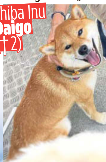
Shiba Inu Daigo (†2)