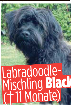
Labradoodle-Mischling Blacy (†11 Monate)