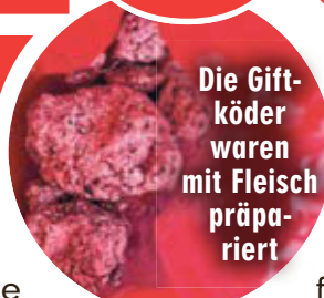
Die Giftköder waren mit Fleisch präpariert

positiv auf Heroin und Amphetamin aus. Für viele Hunde das Todes-Urteil.