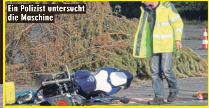
Ein Polizist untersucht die Maschine