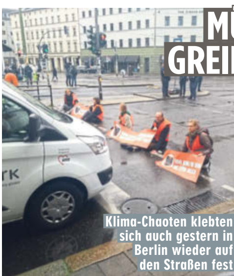
Klima-Chaoten klebten sich auch gestern in Berlin wieder auf den Straßen fest

Berlin - Endlich sorgt ein Richter für Gerechtigkeit: In München erhalten zwölf Klima-Kleber der sogenannten „Letzten Generation“ 30 Tage Knast! Wiederholt hatten die Klima-Chaoten sich an wichtige Verkehrsknotenpunkte geklebt. Weil sie weitere Blockaden ankündigten, verlängerte ein