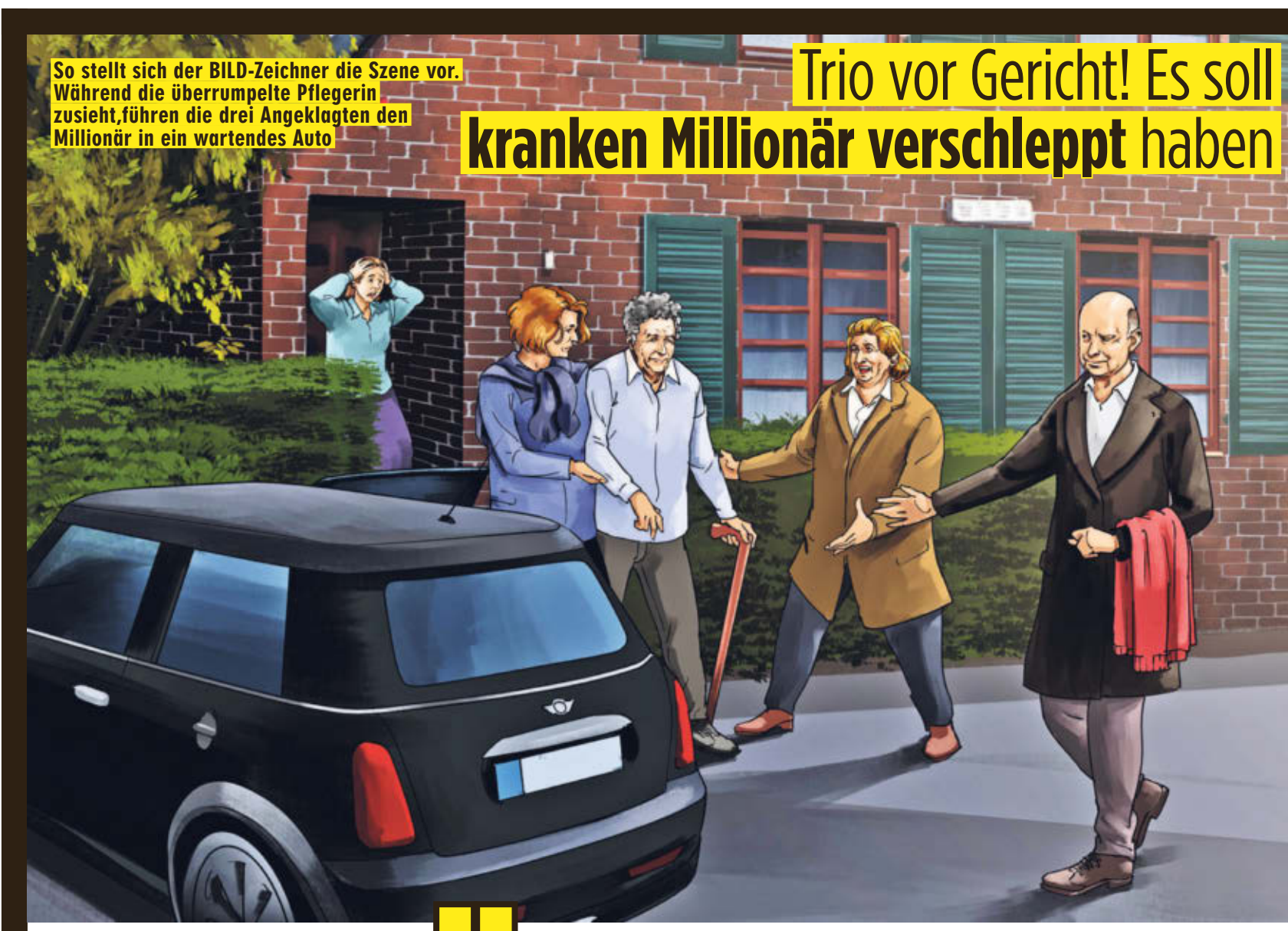
So stellt sich der BILD-Zeichner die Szene vor. Während die überrumpelte Pflegerin zusieht, führen die drei Angeklagten den Millionär in ein wartendes Auto