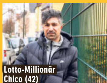
Lotto-Millionär Chico (42)