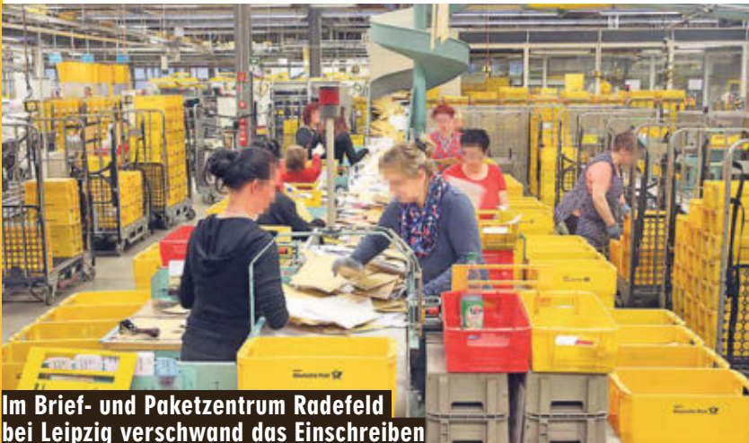
Im Brief- und Paketzentrum Radefeld bei Leipzig verschwand das Einschreiben