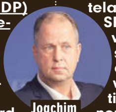
Joachim Stamp (52)

Berlin - Entscheidung des Postens montags blockiert. SPD-Fraktionsvize Dirk Wiese (39): „Gut, dass diese wichtige Position jetzt im Innenministerium besetzt wird.“ CDU-Chef Friedrich Merz (67) forderte von der Ampel „eine Rückführungsoffensive“ von Ausländern, die „weder in den Arbeitsmarkt noch diese Gesellschaft zu integrieren“ sind. (Jan)