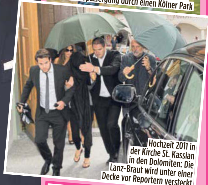
Hochzeit 2011 in der Kirche St. Kassian in den Dolomiten: Die Lanz-Braut wird unter einer Decke vor Reportern versteckt