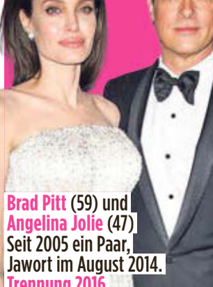
Brad Pitt (59) und Angelina Jolie (47) Seit 2005 ein Paar. Trennung 2016

Darum berührt uns das immer wieder so sehr