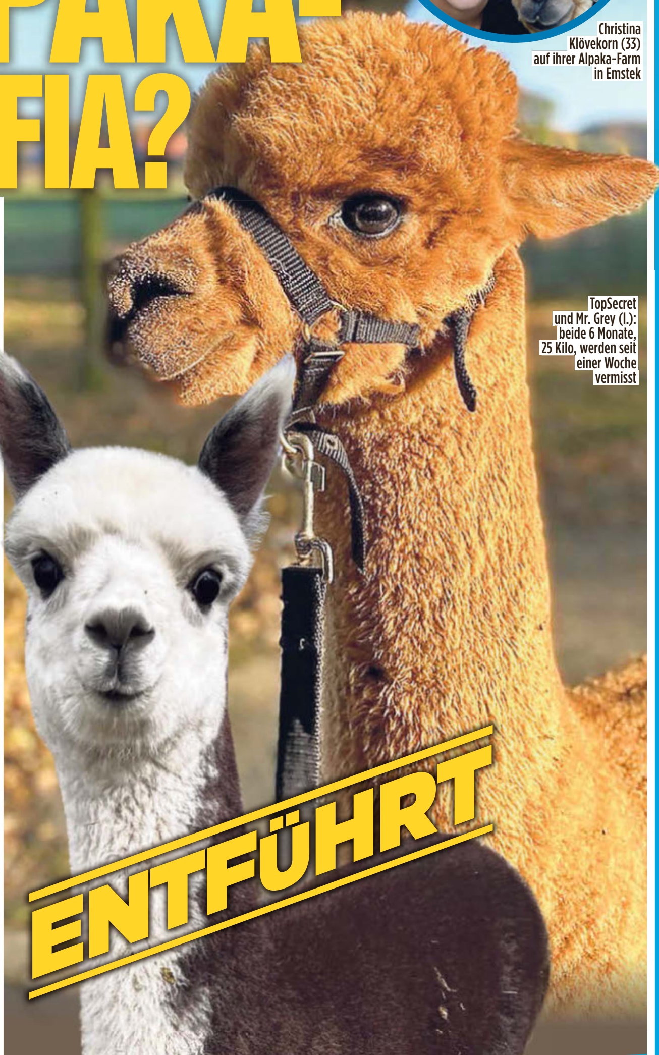
TopSecret und Mr. Grey (l.): beide 6 Monate, 25 Kilo, werden seit einer Woche vermisst