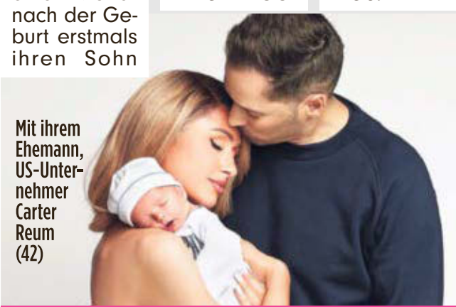
Mit ihrem Ehemann, US-Unternehmer Carter Reum (42)

Magazin „Glamour“ erzählte Hilton jetzt, dass sie vor 20 Jahren schon mal schwanger war – das Kind aber abtrieb.